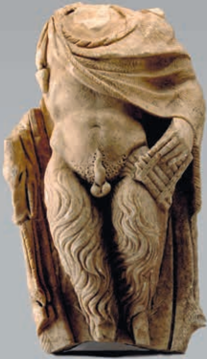
▲ Sculpture ornementale antique Décor du théâtre antique, représentation du dieu Pan, I er siècle après J.-C. (Apt, 2000)

Les vestiges archéologiques sont irremplaçables et fragiles. Le Service d'Archéologie du Conseil départemental de Vaucluse a pour objectif, par ses diverses missions de service public, de les protéger et de les conserver, permettant ainsi d'éclairer notre passé tout en accompagnant les projets d'aménagement.