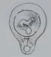
Mobilier funéraire antique ▲ Lampes à huile en céramique, I er -II e siècles après J.-C. (Orange - nécropole de Fourches-Vieilles, 1999)

▼ Faisselle en céramique non tournée Oppidum du Mourre de Sève, Sorgues, VI e - V e siècles avant notre ère