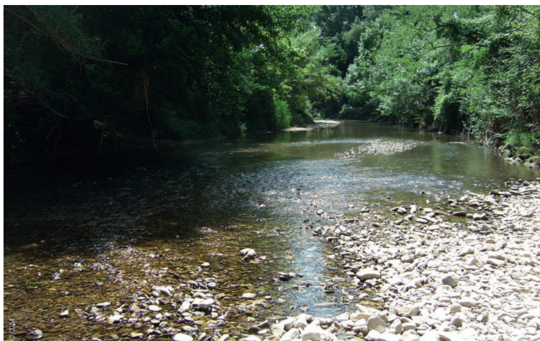
Le Lez à Bollène

La qualité des cours d'eau de Vaucluse est surveillée depuis 2002 grâce à un réseau de stations de mesures . Cet outil précieux permet de vérifier concrètement les effets des investissements réalisés dans les domaines de l'assainissement et de l'aménagement des rivières . Il permet d'identifier des « points noirs » qui sont ainsi signalés aux différents acteurs locaux (Syndicats de Bassins Versants, Communes et EPCI) afin qu'ils puissent les résorber. Les stations de prélèvements sont choisies chaque année avec l'ensemble des partenaires.