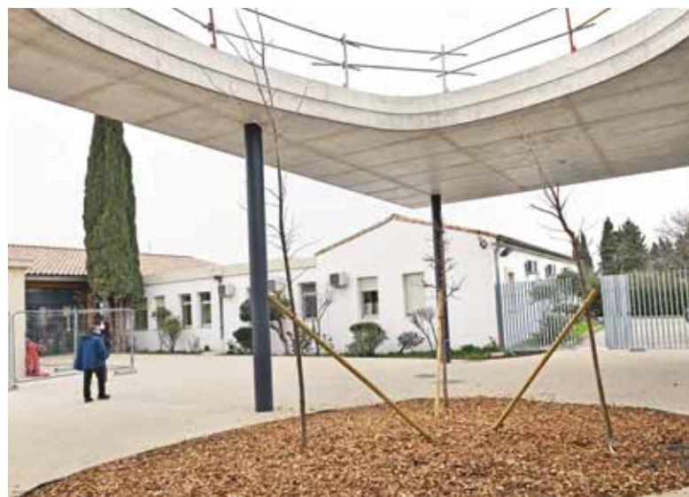
Ci-contre : au collège du Thor, un nouveau parvis accueille les élèves.

Point fort de ces aménagements qui se sont terminés fin août, la construction d'une demi-pension, marquant l'entrée de l'établissement grâce à la création d'un parvis sécurisé. Quant au bâtiment existant, sa réhabilitation a permis d'agrandir l'infirmerie, tout en aménageant une salle polyvalente et une salle pour les enseignants. L'opération, d'un montant de 6,3 M€, est financée par le Conseil départemental mais aussi par l'Etat, à hauteur de 30% via la Dotation de Soutien à l'Investissement Départemental (DSID).