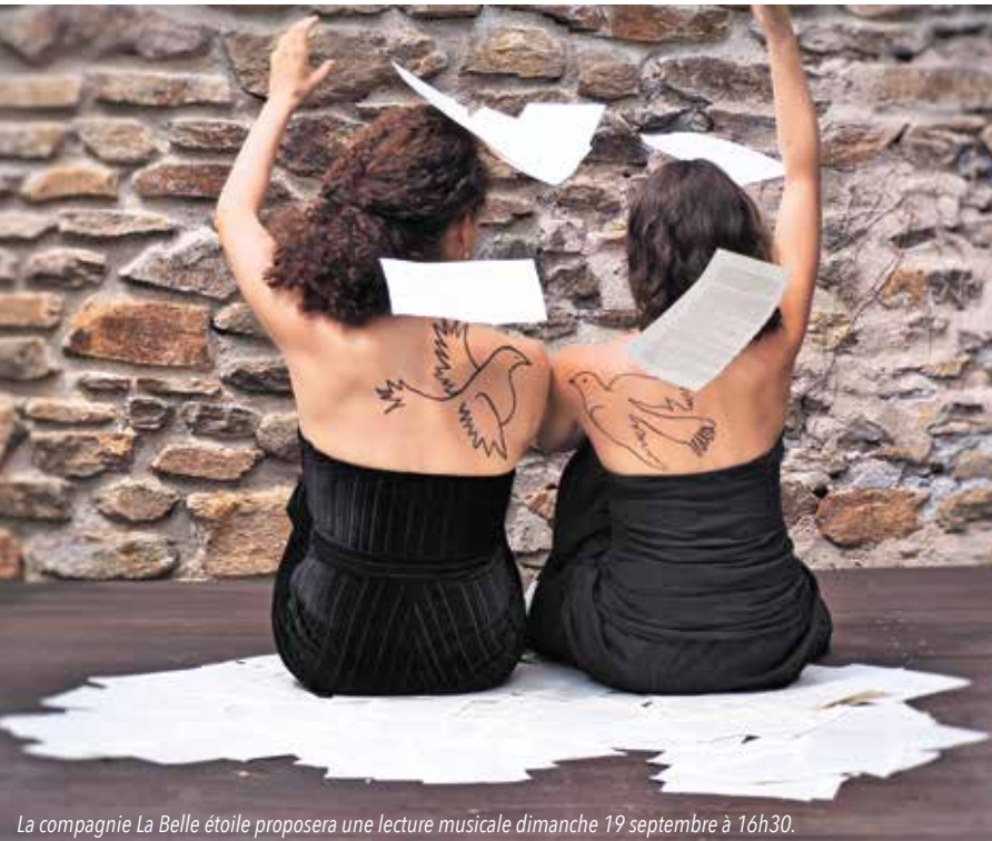
La compagnie La Belle étoile proposera une lecture musicale dimanche 19 septembre à 16h30.

Les 18 et 19 septembre, à l'occasion des Journées Européennes du Patrimoine, le Département vous propose de passer gratuitement la porte de ses musées, de ses Archives, de la chapelle Saint-Charles et de l'hémicycle de l'Hôtel du Département, à Avignon, au fil d'un programme (très) éclectique.