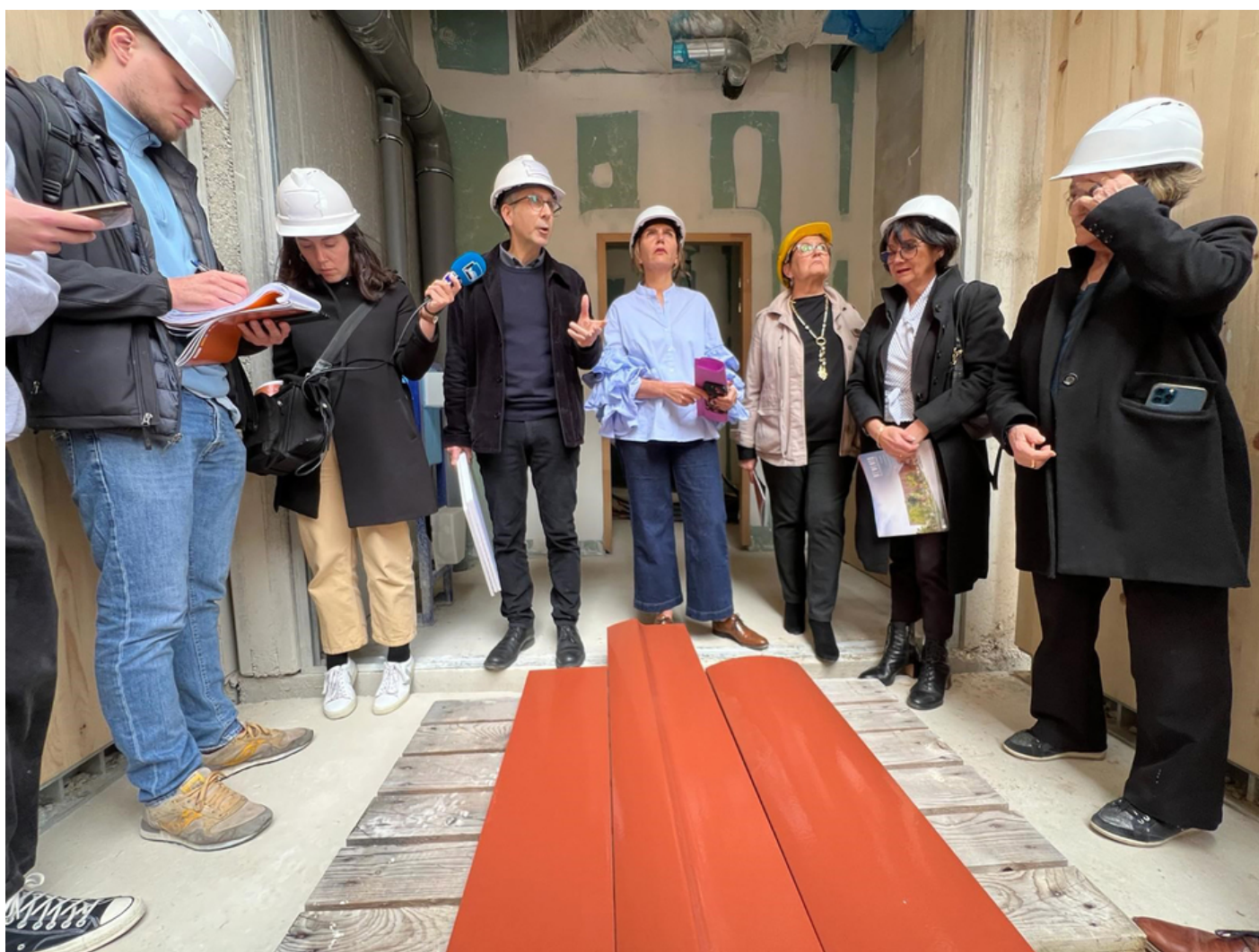
La Présidente Dominique Santoni a effectué une visite sur le chantier de Memento, futur Pôle des patrimoines de Vaucluse.

Présentes depuis le lancement du chantier en janvier 2023, les grues ont quitté dernièrement le site, marquant la fin des opérations de gros œuvre et la réalisation des structures en béton. La toiture du hall principal sera réalisée prochainement. Ce hall, largement vitré, sera le point d'entrée du public. Il desservira les différents espaces au rez-de-chaussée (salle de lecture, auditorium et salles d'exposition ou de détente).