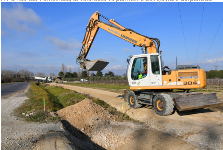
A Orange, le Département réalise actuellement des travaux pour réaliser la dernière partie permettant de rejoindre le centre-ville.

Quant à la section entre l'ancienne gare de Jonquières (6 km également) et Orange, elle sera, pour sa part, ouverte