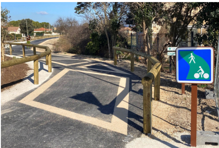
A Pernes-les-Fontaines, la véloroute va permettre de rejoindre Carpentras.

Dès le mois de mars, ce sera d'abord le tronçon reliant Carpentras à Pernes-les Fontaines (6 km) d'être mis en service. L'heure est aux ultimes aménagements, notamment pour finaliser le marquage au sol.