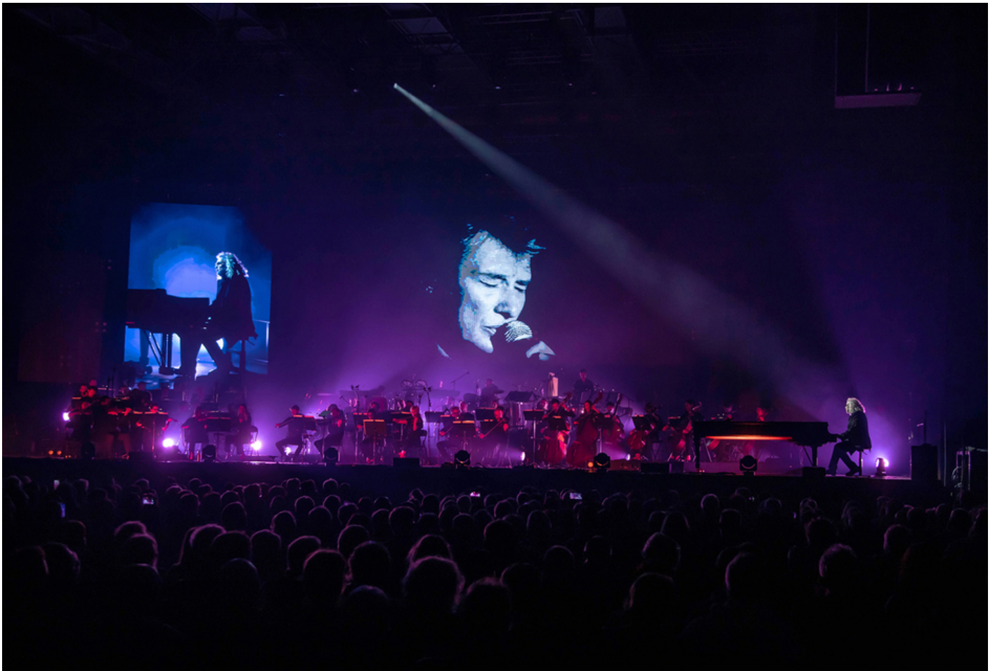
Le 24 juin, « Johnny Symphonique » célébrera le répertoire de Johnny Hallyday.