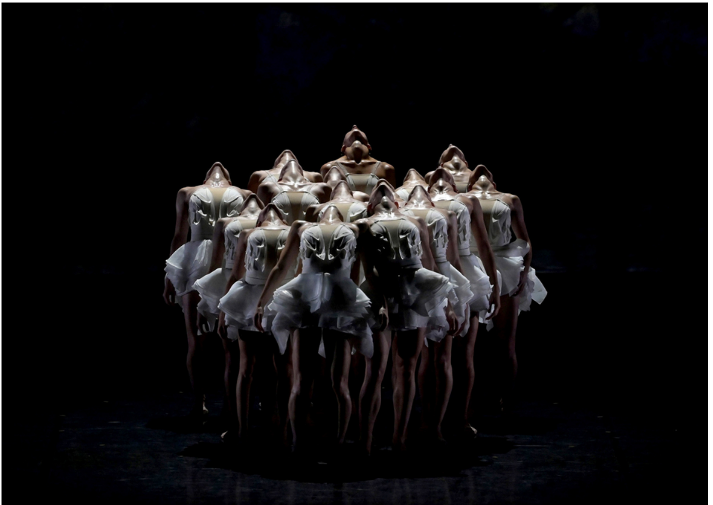
Le 12 juillet, « Le Lac des cygnes » d'Angelin Preljocaj.

Une édition 2025 pleine de promesses puisque 13 spectacles seront programmés, contre 10 l'année précédente. « La dernière saison, qui était transitoire, a été positive précise Jean-Louis Grinda, Directeur des Chorégies. Après des années d'incertitude, l'optimisme semble être de rigueur avec un budget à la hausse, qui passe de 3,2M€ à 4,8M€ ». L'occasion de rappeler le soutien des collectivités locales, notamment du Département, qui a accordé une subvention de 300 000€ pour l'édition 2024. Par ailleurs, les Chorégies vont changer de statut et devenir un EPCC, un établissement public de coopération culturelle. « Cela permettra à l'État et aux donateurs privés d'entrer dans le Conseil d'Administration ».