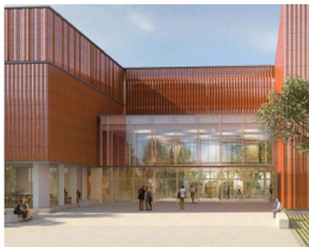
Vue du hall depuis le parvis