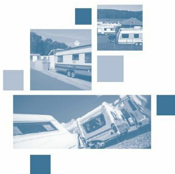
SCHÉMA DÉPARTEMENTAL D'ACCUEIL ET D'HABITAT DES GENS DU VOYAGE DE VAUCLUSE