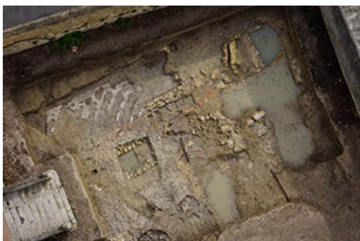
Orange, avenue des thermes

Les archéologues fouillent, découvrent, documentent, étudient, publient, exposent et expliquent... Créé en 1983, le service départemental d'archéologie est agréé par l'Etat depuis 2006 pour réaliser des diagnostics et des fouilles préventives portant sur les périodes antique et médiévale à l'occasion des travaux de construction, d'urbanisme et d'aménagement du territoire.