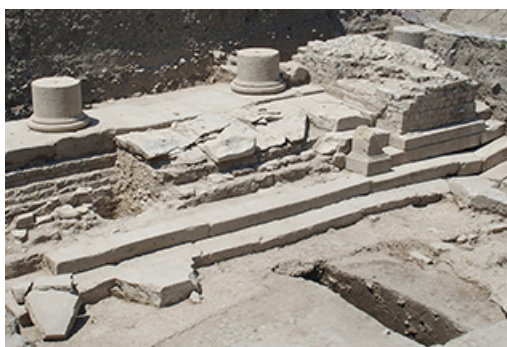
Forum, Vaison-la-Romaine

En complément de ses missions préventives, le Service d'Archéologie du Département réalise des opérations de fouille s'inscrivant dans un programme de recherche