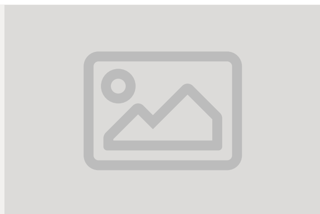
Les Archives départementales de Vaucluse