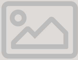
Église Abbatiale Notre-Dame de Senanque